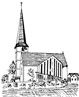
St. Johannes der Täufer Großeibstadt