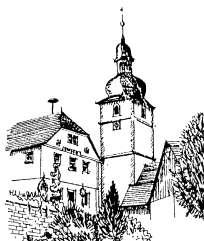
St. Margareta Großbardorf