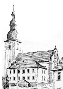
St. Bartholomäus Kleineibstadt